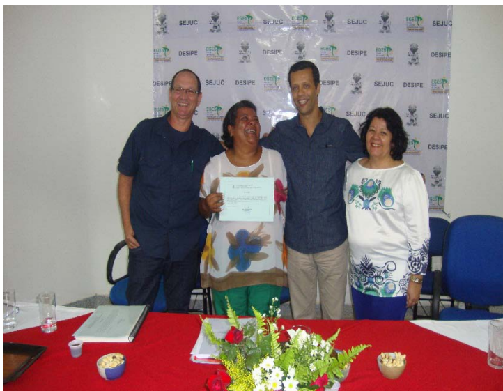
Da esquerda para a direita:

Destacamos, neste sentido, a importância da criação de Centros/Grupos/Núcleos de estudos no interior das universidades que dão suporte às pesquisas no âmbito da Educação Física e Ciências do Esporte, assim como nosso LaboMídia/UFS que vem ratificando sua criação movimentando e ampliando a produção no campo da EF.